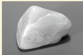
ヒスイを「県の石」に

県では、ヒスイの「県の石」指定に際し、諮問していた検討委員会から県知事に「指定することがふさわしい」と、9月16日に答申がありました。今後、県議会で承認されると、ヒスイが正式に「県の石」として指定されることになります。指定後は県と協力して、県内外に広くPRするとともに、交流人口の拡大や教育における利活用等に努めて参ります。